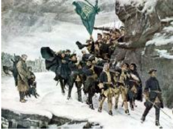
Foto: Karl 12's død - Felttog i Norge 1716-1718.