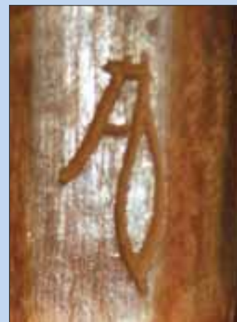
SIGNATUREN: Denne signaturen er preget inn i klubba. Nå lurer Inderøy Ap om noen vet hvemns signatur dette er?