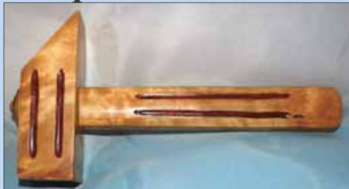
AP-KLUBBA: Slik ser det ut, klubba som Ap mottok i 1959. Nå lurer det lokale partilaget på hvem det er som har laget den.

I 1959 mottok Inderøy Ap ei klubbe i gave. Nå lurer partiet på hvem det er som har laget den.